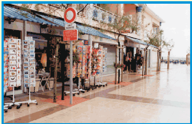
OrgaDRAIN draagt bij aan een uniform uiterlijk van winkelstraten