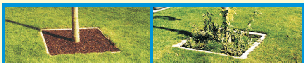
Boomkransen met en zonder OrgaDRAIN